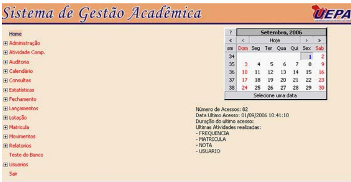
Figura 2- Home SIGA