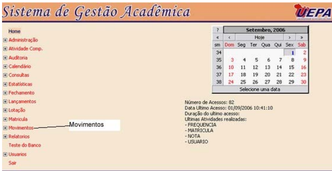
Figura 3- Iniciando o link Movimentos

Para iniciar o sistema de movimentos é necessário clicar no link "Movimentos" como mostra a figura abaixo: