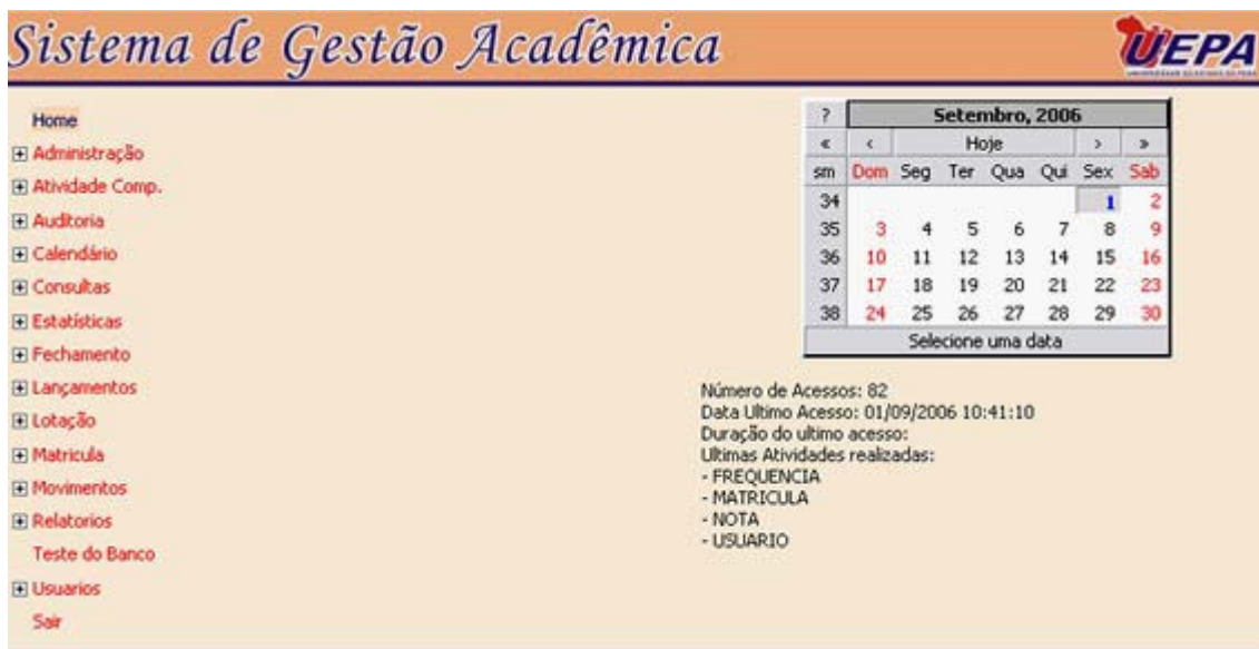
Figura 2- Home do SIGA

- Após logar no Sistema, aparecerá a seguinte janela figura 2):