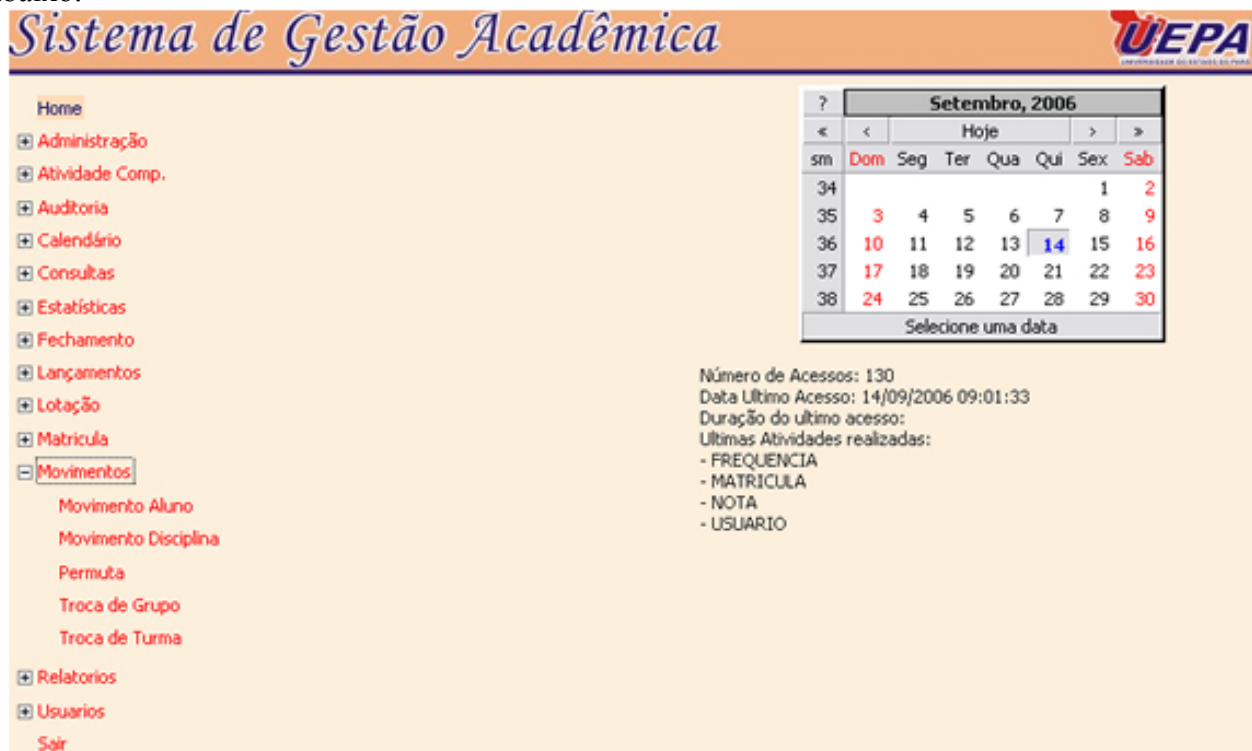
Figura 4- Sub-módulo Movimentos

Ao clicar no link movimento é possível visualizar os seus sub-módulos como mostra a figura abaixo: