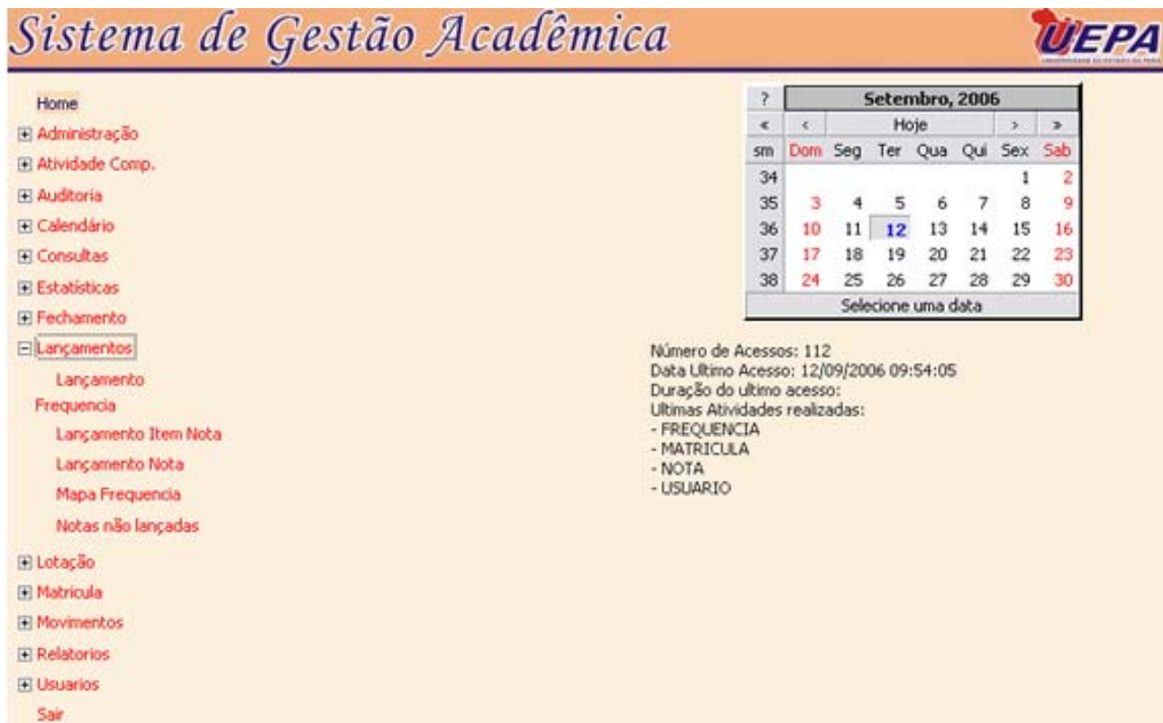
Figura 3 – Sub-Módulos

Para iniciar o sistema de lançamento é necessário clicar no link "Lançamento" como mostra a figura abaixo: