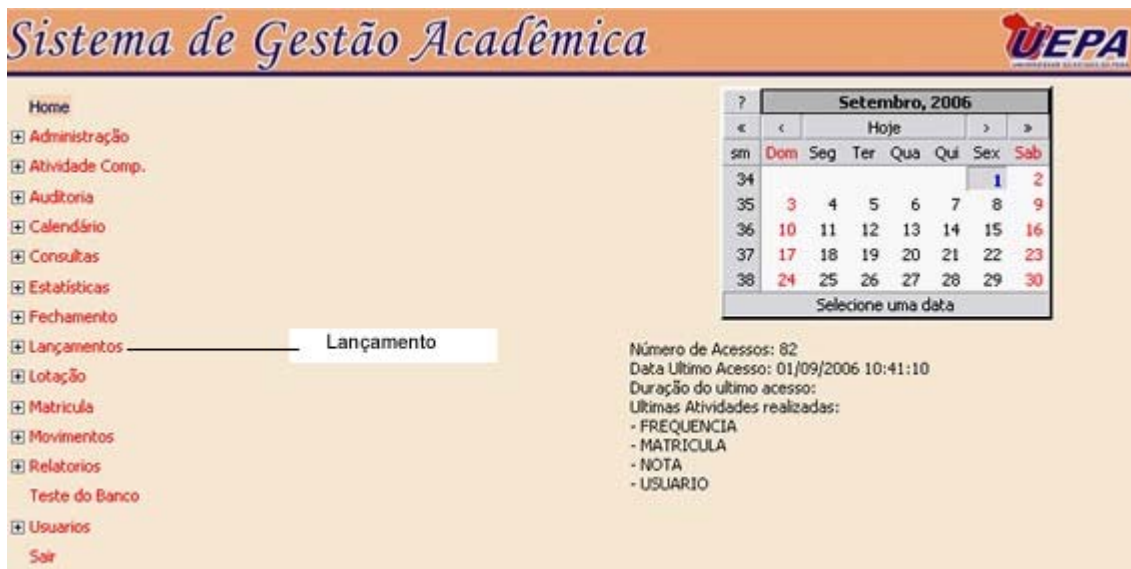
Figura 2 – Módulo Lançamento

Para iniciar o sistema de lançamento é necessário clicar no link "Lançamento" como mostra a figura abaixo: