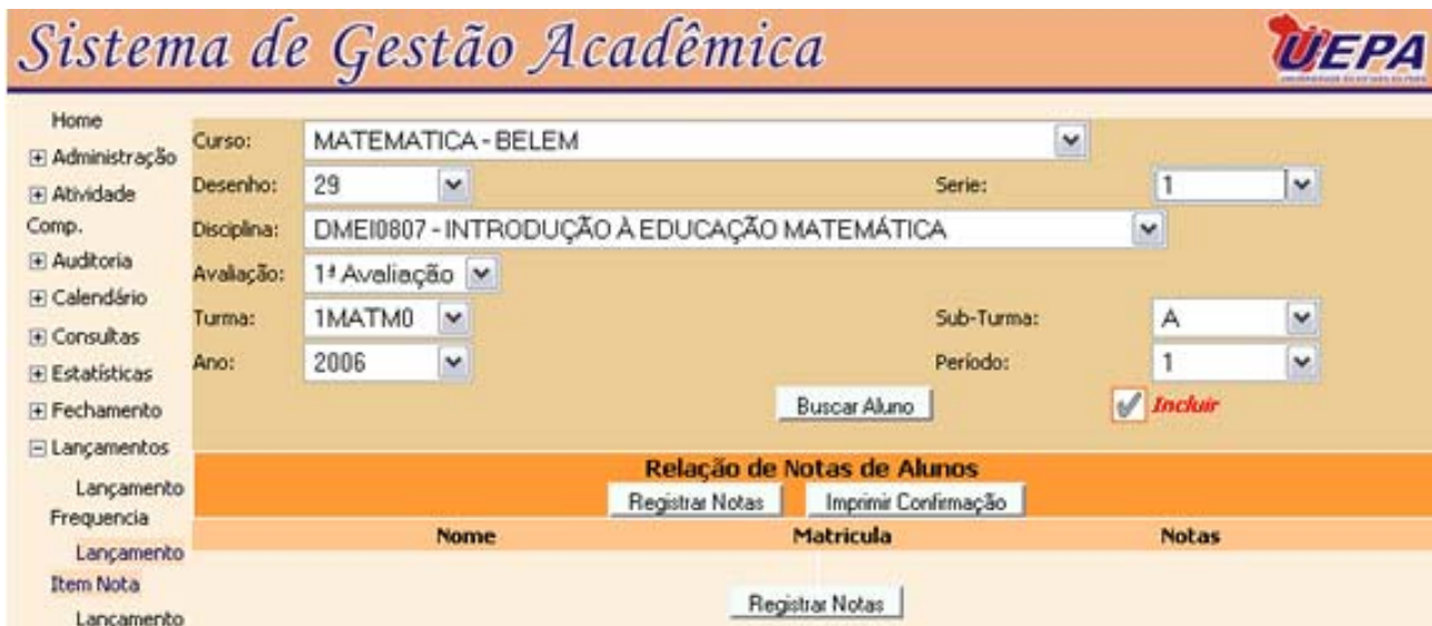
Figura 9- Lançamento Item Nota