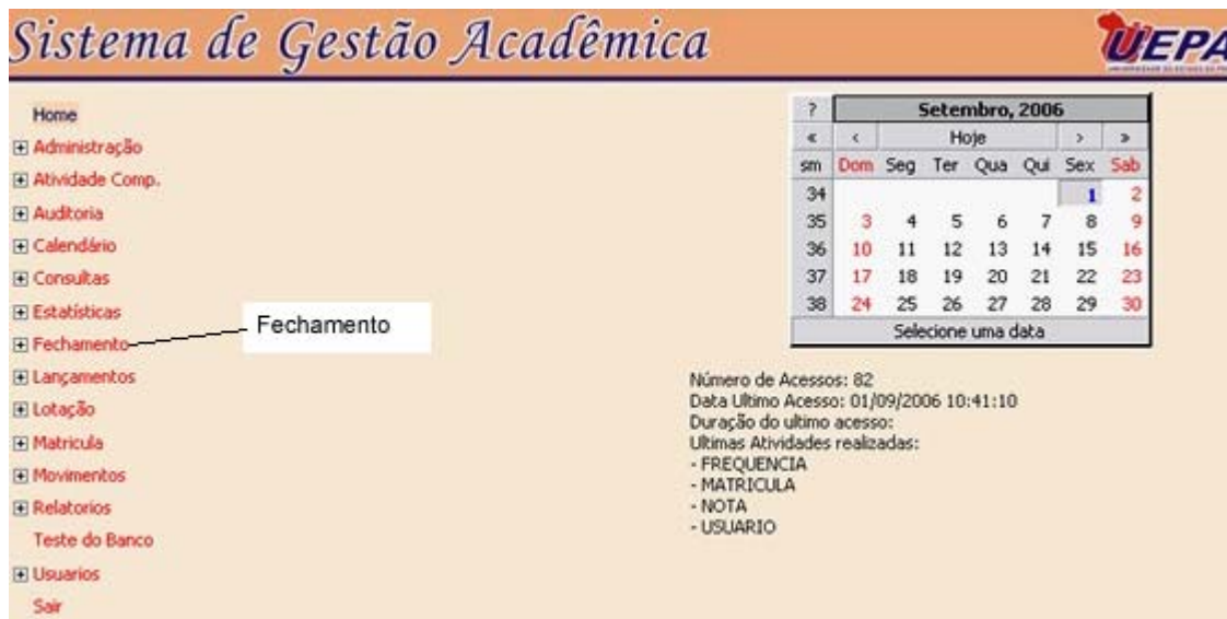
Figura 3- Iniciando o link Fechamento

Para iniciar o sistema de fechamento é necessário clicar no link "Fechamento" como mostra a figura abaixo: