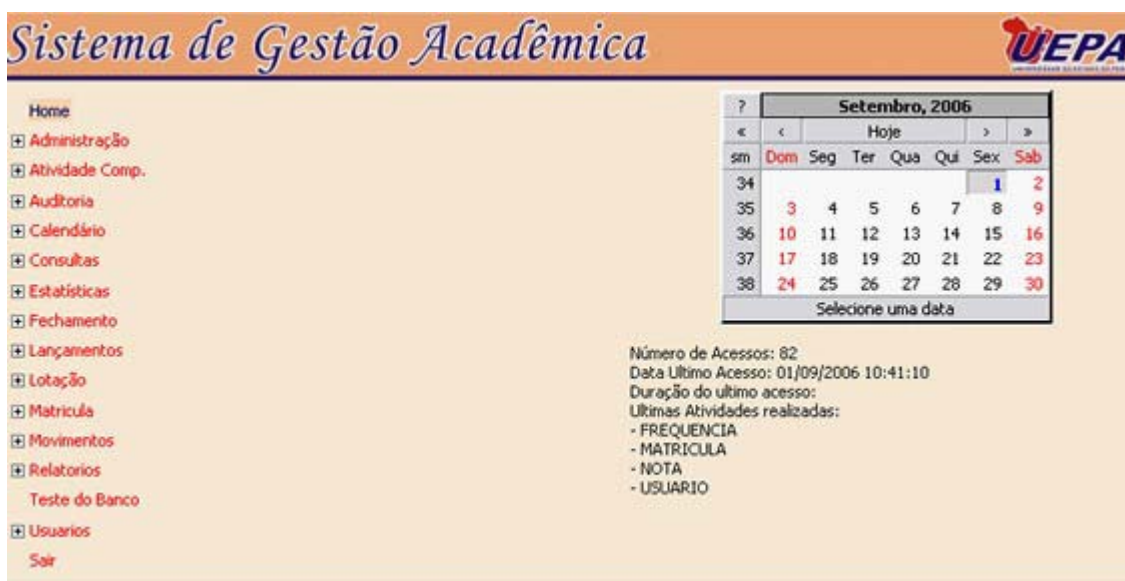
Figura 2- Home do SIGA

- Após logar no Sistema, aparecerá a seguinte janela figura 2):