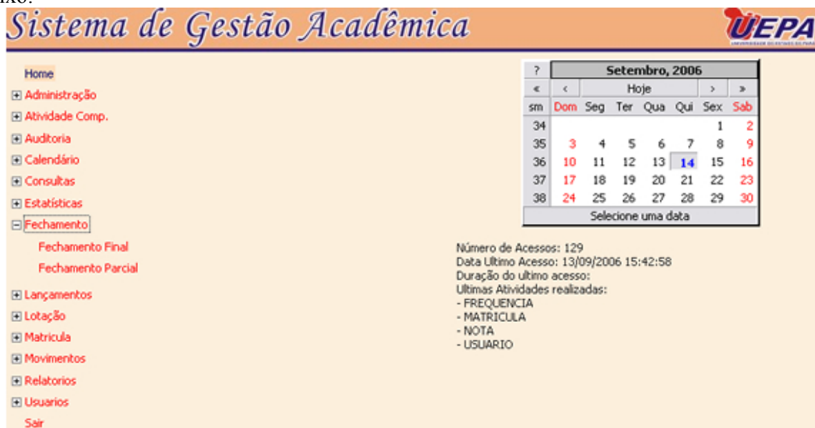
Figura 4- Sub-módulo de Fechamento

Ao clicar no link fechamento é possível visualizar os seus sub-módulos como mostra a figura abaixo: