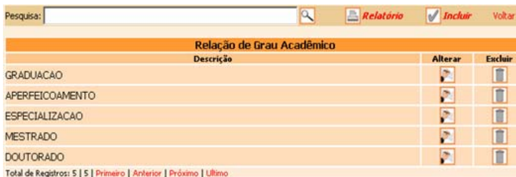
Figura 5- Relação de Grau Acadêmico

O sub-módulo Grau Acadêmico tem o mesmo funcionamento que área concentração.