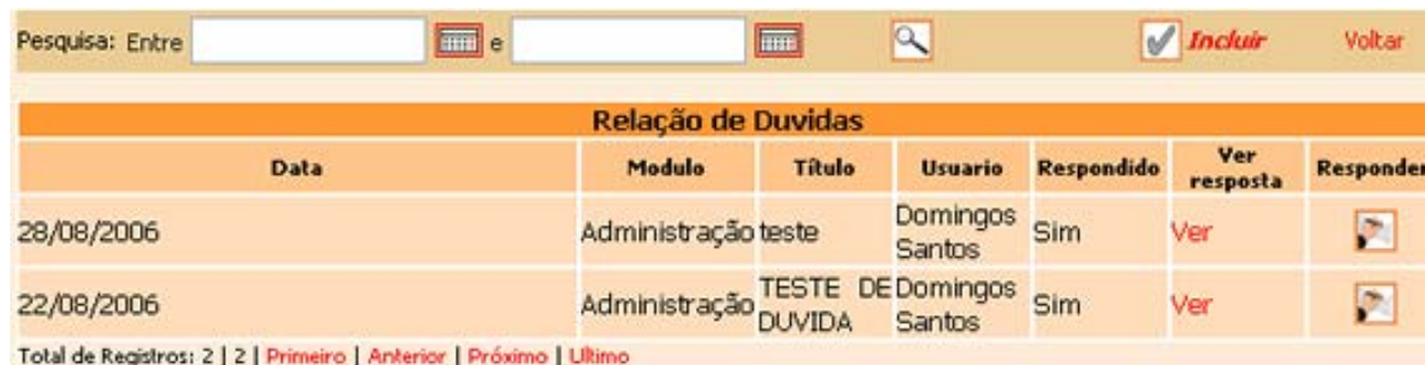
figura 3- Relação de Dúvidas

O sub-módulo Atendimento on-line inicia com uma lista de dúvidas e uma pesquisa. Na pesquisa deve ser informado um intervalo de datas para a pesquisa, onde para selecionar o intervalo basta clicar no botão data inicial selecionar a data e fazer o mesmo procedimento para a data final. Após selecionado o intervalo, basta clicar no botão de pesquisa para que seja listada as dúvidas referente ao intervalo de datas selecionada.