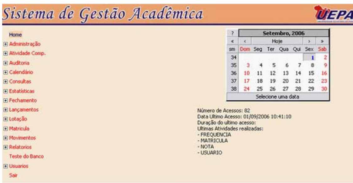
Figura 2 – Home SIGA