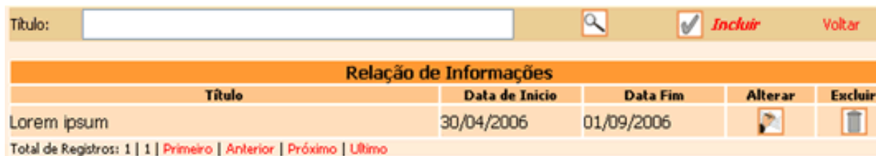
Figura 4- Relação de Informações

O sub-módulo Informação tem o mesmo funcionamento que área concentração.